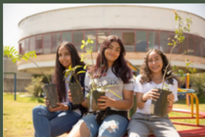
Iniciativa quer plantar miniflorestas em 650 escolas públicas

A organização sem fins lucrativos formigas-de-embaúba busca apoiadores para ampliar seu trabalho de levar miniflorestas para escolas.