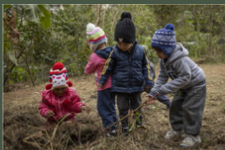
ONG Formigas-de-embaúba planta miniflorestas de mata atlântica em escolas de São Paulo

Projeto recria ecossistema de árvores nativas em espaços reduzidos