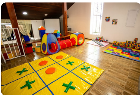
Interior do CIEM

As crianças atendidas pelo CIEM contam com o apoio de uma equipe especializada, composta por psicólogos, psicopedagogos, professores, nutricionistas, fonoaudiólogos, fisioterapeutas e terapeutas ocupacionais, que atendem às necessidades individuais de cada aluno. Esse apoio multidisciplinar não apenas promove a inclusão, mas também garante que cada criança tenha acesso aos seus direitos fundamentais, como a educação de qualidade, a saúde e o respeito à sua singularidade.