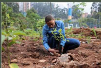
Ativistas mirins plantam miniflorestas em escolas e criam oásis urbanos em SP

Quatro mil alunos plantaram quase 10 mil árvores em escolas públicas de São Paulo até o final de 2022. Em 2023, serão implementadas mais oito miniflorestas. A iniciativa da ONG formigas-de-embaúba tem o potencial de alcançar 650 escolas.