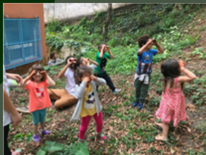
Projeto de educação ambiental formigas-de-embaúba cria miniflorestas em escolas públicas de SP

Instituição promove o plantio participativo de mudas da Mata Atlântica com estudantes de 2 a 14 anos, além de oferecer formação a professores para projetos realizados pela comunidade escolar