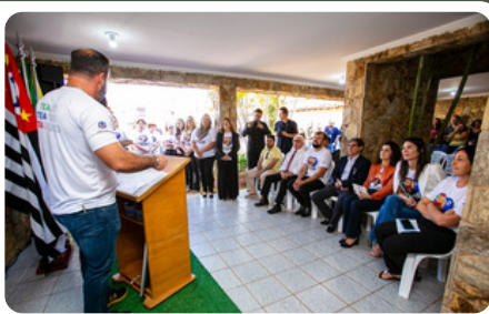
Inauguração do CIEM