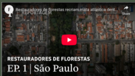
ONG planta miniflorestas em escolas públicas de SP - 09/08/2024 - Folha Social+ - Folha

ONG Formigas-de-embaúba faz restauração florestal no meio da cidade, com plantio de mais de 100 espécies de árvores nativas em pequenas áreas